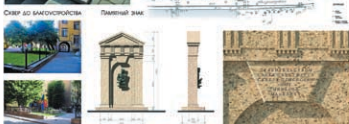
Реализация проекта благоустройства Сквера Михаила Маневича (авторы: А. Ю. и Г. Л. Шолоховы, Е. В. Забелина), представленная в рамках конкурсной программы премии

и реконструкции зданий. Несколько таких проектов сейчас ведется на основании контрактов с ГУ «Дирекция по содержанию жилого фонда», а также с другими заказчиками, в том числе и по объектам в Калининграде и Олимпийском Сочи. Как уже говорил, совместно с АМ «Интарсия» очень большую работу мы проделали по проектированию павильонов и благоустройства нового зоопарка.