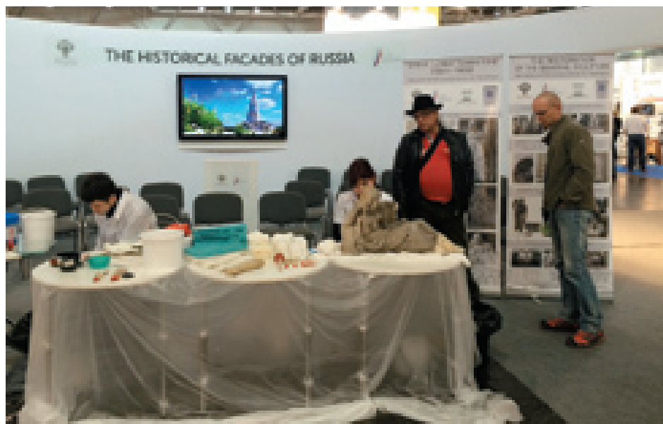
Специализированная выставка Denkmal-2014. Мастер-классы по реставрации скульптуры на главном российском стенде

Тематическая структура главного стенда формировалась не только в увязке с первоначальной функцией самих памятников, но также с учетом целей и содержания выполнявшихся там работ. Так, знакомясь с разделом «Объекты гражданского назначения», можно было получить конкретное представление о реставрационных ремонтах зданий Большого драматического театра им. Г. А. Товстоногова в Санкт-Петербурге и Гостиного двора в Архангельске, главного дома Усадьбы М. В. Асеева в Тамбове и построек Астраханского кремля. Наряду с этим, отдельно были представлены итоги реконструкций Сочинского цирка и Восточного крыла Главного штаба Государственного Эрмитажа. В первом случае проект был реализован в ходе подготовки к Зимней Олимпиаде-2014, во втором — получил «зеленый свет» в рамках программы, финансируемой по линии МБРР.