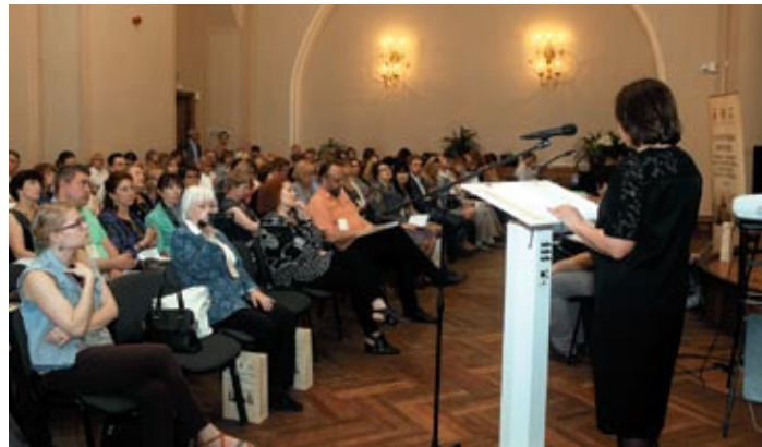
Из фотохроники заседаний тематических секций 28 мая 2015 г.