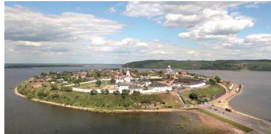
Достопримечательности столицы Татарстана: остров-град Свияжск; памятник «Зодчим Казанского кремля» у стен Благовещенского собора; «падающая» сторожевая Башня Сююмбике; Белая (Одиннадцатая соборная, Большая каменная) мечеть в Ново-Татарской слободе