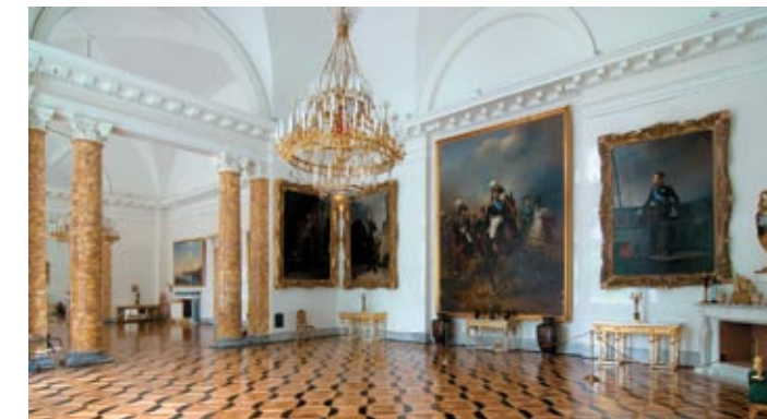
Интерьеры Полукруглого и Портретного залов Парадной анфилады, сохранившие комплексную историческую отделку и, по заключению специалистов «Студии 44», нуждавшихся в незначительном объеме реставрационных работ

планировалась реставрация чудом уцелевших кваренгиевских интерьеров. Однако именно тогда многие элементы отделки Кленовой и Палисандровой гостиных императрицы Александры Федоровны, а также Мавританской уборной ее царственного супруга были уничтожены. «Академическая» глава в новейшей истории здания оказалась чуть ли не самой короткой: в 1951 г. весь объект перевели на баланс ВМФ, а здешнюю коллекцию, которая на тот момент еще находилась в Центральном фондохранилище среди собраний, эвакуированных из пригородных дворцов-музеев, передали в Павловск.