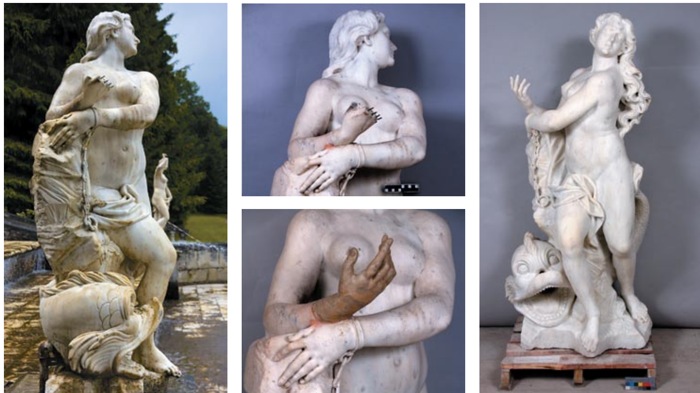
Статуя Андромеды до реставрации, в процессе производства работ и после их завершения