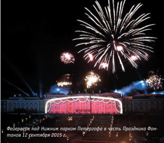
Фейерверк над Нижним парком Петергофа в честь Праздника Фонтанов 12 сентября 2015 г.