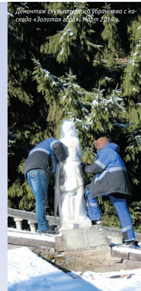
Демонтаж скульптурного убранства с каскада «Золотая гора». Март 2014 г.