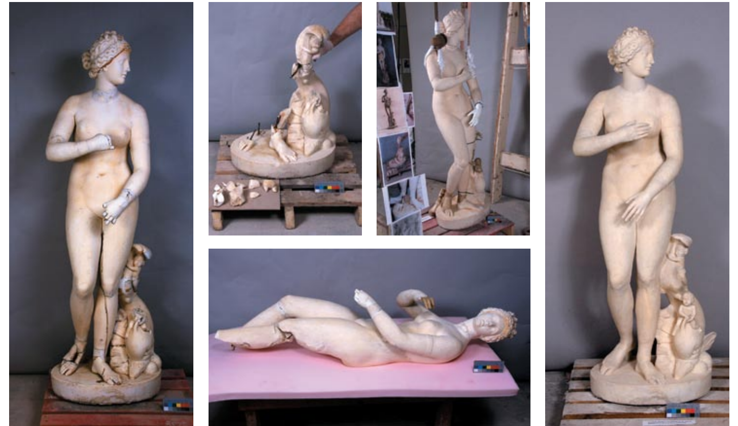
Статуя Венеры Медицейской до реставрации, в процессе производства работ и после их завершения

— Неоценимым подспорьем в нашей работе по восполнению утраченных фрагментов