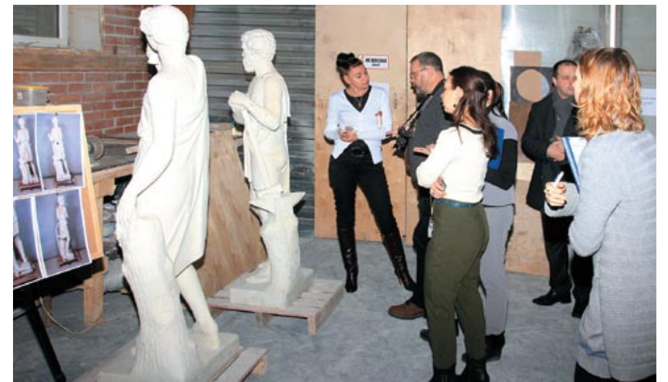
Плановое совещание реставрационного совета в мастерской «Наследие». Февраль 2015 г.

К началу наших работ состояние статуи можно определить, как аварийное: деструкция каменного материала с грануляцией кристаллов мрамора, интенсивные загрязнения, подтеки и пятна ржавчины, многочисленные швы склейки, поздние реставрационные вставки, подвижные фрагменты, утраты. При проведении работ, для предотвращения обрушения, памятнику было придано горизонтальное положение, после чего производились расшивка швов склейки