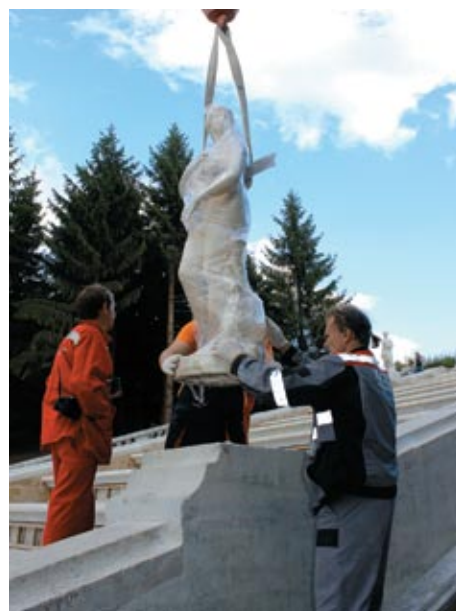
Послереставрационный монтаж статуи «Венера Медицейская» и коллективное фото специалистов ООО «РМ «Наследие» на память о дне возвращения скульптуры каскада на исторические места. Август 2015 г.

С этой задачей справиться удалось, заранее выложив бетонные плиты по маршруту следования техники. Проблематичнее оказалось договориться с «небесной канцелярией». С рассвета зарядил дождь и долго мешал начать работу. Только ближе к сумеркам погода наладилась, и мраморные скульптуры одна за другой стали занимать свои привычные места.