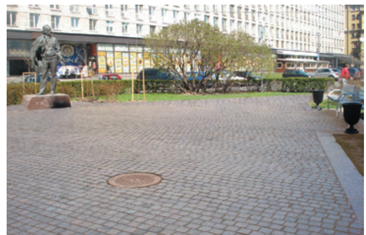
Благоустроенная площадка перед памятником Г. А. Товстоногову, установленным в сквере его имени 7 октября 2010 г.

Невозможно сказать, кто и когда ввел в наш обиход метафору «лицо города», но она живет и даже дала название одной из книг известного искусствоведа В. Л. Глазычева. Автор подразумевал под этим архитектурное пространство, обрамленное наиболее красивыми зданиями, чаще всего главную улицу или площадь, иногда сквер, набережную. В тоже время самая великолепная архитектура без фонарей, скамеек, красивого тротуара и цветника воспринимается нами скорее как памятник, нежели комфортное пространство для жизни. Образно говоря, мимика в данном случае передается через благоустройство, которое словно улыбка оживляет городскую среду.