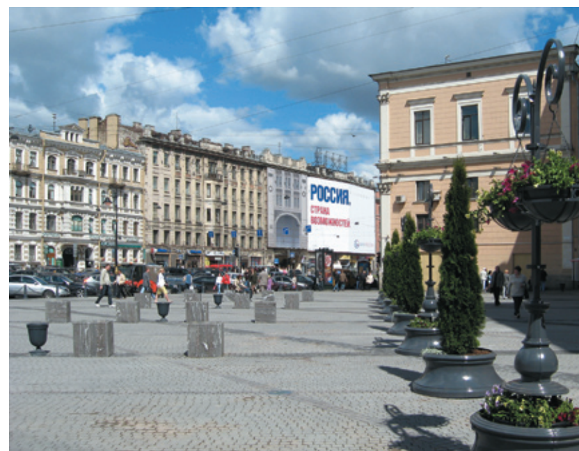
Хроника производства и результаты комплексных благоустроительных работ у многофункционального комплекса «Галерея»