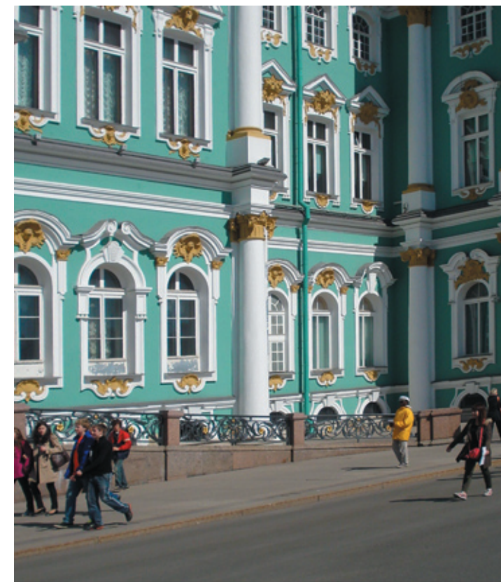
Участок восстановленного тротуарного покрытия перед зданием Государственного Эрмитажа

скамейками и малыми архитектурными формами. Весьма скромный бюджет не оставил места оригинальным решениям, хотя неизменно высокое качество работ, являющееся визитной карточкой «Бика», присутствовало и здесь.