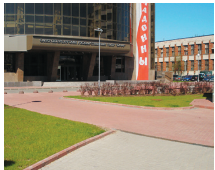
Комплексное благоустройство территории у нового здания Театра Буфф на пр. Шаумяна

Благоустроительных работ после кризиса стало заметно меньше, но они, тем не менее, идут, не давая любимому нами лицу города превратиться в застывшую маску. За последний год силами ЗАО «Бик» — Санкт-Петербург, одной из крупнейших компаний в сфере благоустройства, произведена замена тротуарного покрытия около Эрмитажа со стороны Дворцовой набережной. Там на место постоянно портившегося известняка был уложен бучердированный гранит. В числе недавних работ коллектива обратила внимание горожан и установка памятника Георгию Товстоногову, а также гранитной мемориальной доски в память о выдающемся режиссере во внутреннем дворе здания института «ЛЕННИИПРОЕКТ» на Троицкой площади. Еще одним ответственным подрядчиком для Бика стало комплексное благоустройство вокруг нового здания Театра Буфф, где был разбит небольшой сквер с озелененными зонами, тротуарными дорожками,